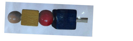
Rythme et perles

Se familiariser avec les motifs organisés