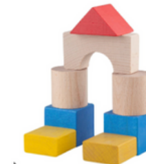
Puzzle, pavage, assemblage