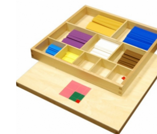
Table de Pythagore