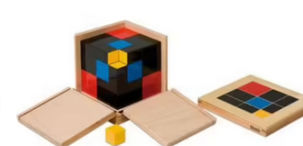
Cube du trinôme