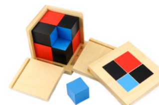
Cube du binôme